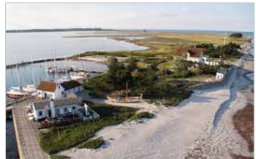
Im Sommerhalbjahr ist das Lotsenhaus und die Lotseninsel Schleimünde ein häufiger Einsatzort

Dein Haupteinsatzort wird Kiel sein, um Veranstaltungen mit zu organisieren und zu betreuen, eine eigene Projektidee voranzutreiben oder einfach etwas Neues auszuprobieren. Du bist an verschiedenen Projekten mit Schülern und Jugendlichen beteiligt und kannst dich an in eigenes Interessensgebiet einarbeiten. Mithilfe ist zudem bei der Öffentlichkeitsarbeit gewünscht, z.B. für das Internet oder beim Erstellen von Informationsschriften. Es kann vorkommen, dass Veranstaltungen auch am Wochenende deine Unterstützung brauchen.