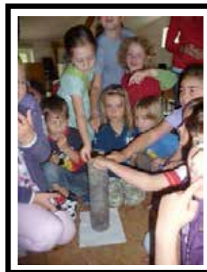
250 Millionen Jahre altes Salz, Geschmacksprobe bei der Kinder-Universität

Inmitten einer wunderschönen eiszeitlichen Stauchmoränenlandschaft nahe der Ostseeküste bringen wir unseren Besuchern die Eiszeit näher. Dazu werden zahlreiche Aktionen für Kinder angeboten, wie z. B. Bernsteinschleifen und vieles mehr. Die Betreuung der Kinder (Schulklassen und Geburtstage) wird eine deiner Hauptaufgaben sein. Außerdem arbeitest du in allen Bereichen des Museums mit: