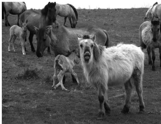
Polnische Wildpferde, Koniks, auf der Birk

Weil du dir viele der Tätigkeiten zum Teil selbst aussuchen kannst/sollst und sie sehr stark von aktuellen Projekten abhängig sind, können wir dir hier kein Standardprogramm auflisten, stattdessen können wir die momentanen Aufgaben beschreiben: