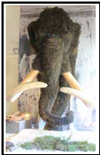
Nachbildung eines Wollhaarmammuts

Dieses Wissen wirst du direkt im Kontakt mit den Besuchern des Schleswig-Holsteinischen Eiszeitmuseums anwenden: wir veranstalten für Familien, Schulklassen und Reisegruppen aller Altersstufen verschiedene Aktionen. Dafür benötigen wir Deine Unterstützung!