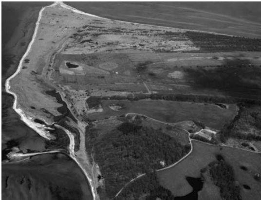
Die Geltinger Birk, Luftaufnahme

Das Naturschutzgebiet Geltinger Birk ist eine Halbinsel am Ausgang der Flensburger Förde. Bereits seit 1934 steht der Kernbereich dieses Gebietes unter Naturschutz und nach schrittweisem Flächenankauf umfasst das Projektgebiet inzwischen fast 600 Hektar. Auf diesen Flächen laufen eine polnische Wildpferdeherde, Koniks, von z. Zt. 80 Tieren sowie eine Herde schottischer Hochlandrinder von ca. 300 Tieren. Die einmalige Landschaft der Geltinger Birk wird von wunderschönen Wanderwegen durchzogen, die jährlich 80.000 Touristen anlocken. Für den Erhalt und die Weiterentwicklung des NSG Geltinger Birk ist die Integrierte Station Geltinger Birk, dein zukünftiger Arbeitsplatz, zuständig. Die Integrierte Station ist ein Zusammenschluss von NABU-Landesverband und der NABU-Gruppe Ostangeln, Landesamt für Landwirtschaft, Umwelt und ländliche Räume Schleswig Holstein, der Stiftung Naturschutz sowie der Gemeinde Nieby, und befindet sich am Rande des NSG.